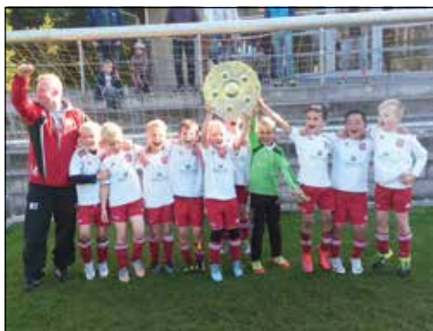
Staffelmeister der Herbstliga.