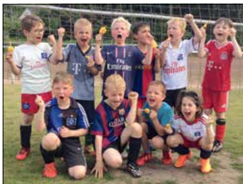
Erstes Training der bunt gemischten Truppe.